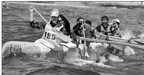
Malgré une grande motivation, le club de Palavas n'arrive toujours pas à décoller et reste dans les profondeurs du classement.