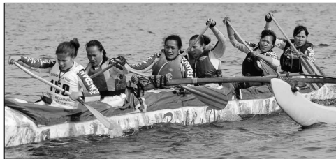
Les filles de Ruahatu en forme, elles ont laissé leurs poursuivantes à plus de 16 minutes.