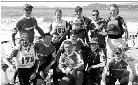
Le jeune club de Manu Ura 13 (Marseille) se cherche encore et termine en 8 e position.