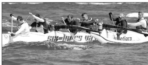
Six-Fours Va'a a dominé la course V6 hommes.