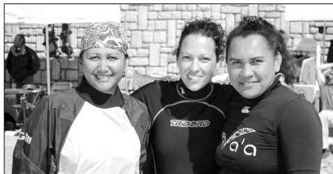
Les filles de La Méduse.