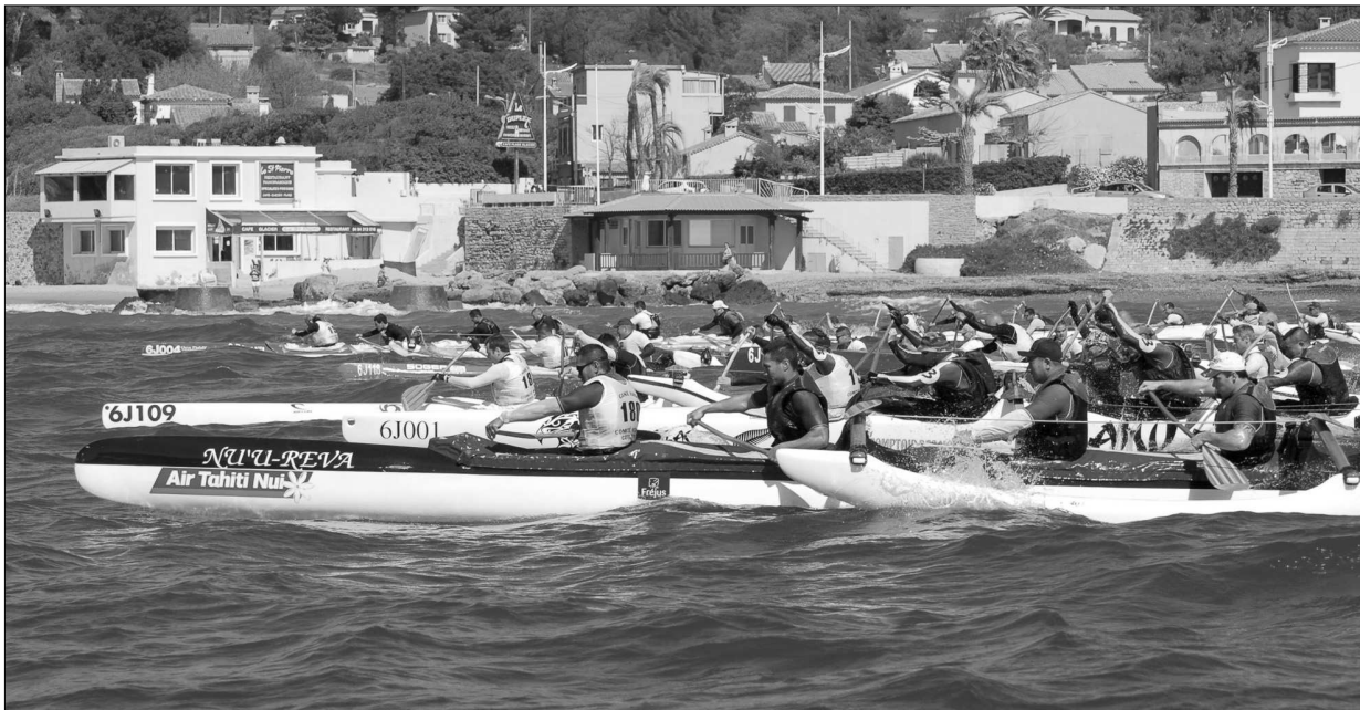
Le départ de la course V6 vient d'être donné.