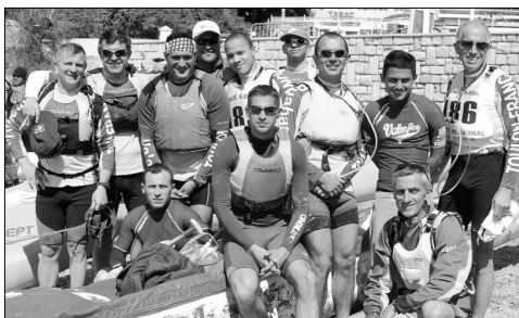
En V6, le club de Ruahatu Va'a n'obtient que les 7 e et 10 e places. Les cadres de l'équipe n'étaient pas présents ce week-end...