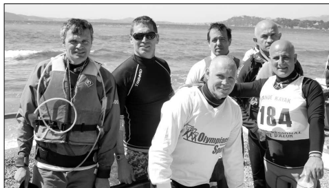
Les vétérans de Manu Ura se sont régalés et ont bien fini la course.